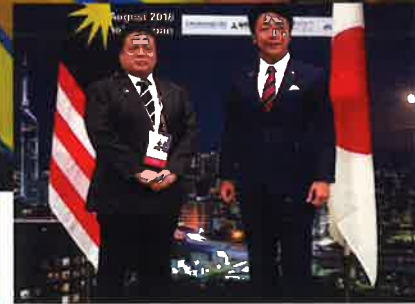
Program Pengantarabangsaan MPT Muka Surat I 15