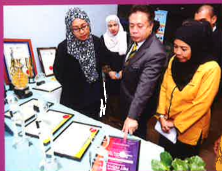
WISMA PERBANDARAN TAIPING

Majlis Perbandaran Taiping telah menerima kunjungan lawatan daripada Pasukan Inspektorat Sistem Penarafan Bintang Pihak Berkuasa Tempatan (SPB-PBT) pada 18 Julai 2018.