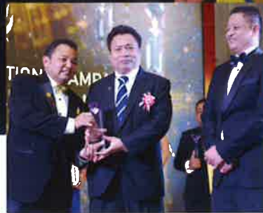
Malaysia Tourism Gold Award Muka Surat I 09