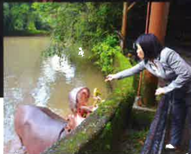
Lawatan Delegasi Bandaraya Fukuoka Jepun ke Taiping Muka Surat I 07