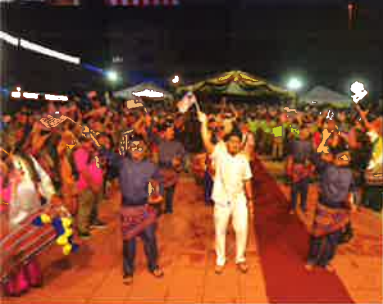
Sambutan Hari Malaysia Peringkat Negeri Perak 2018 Muka Surat I 06